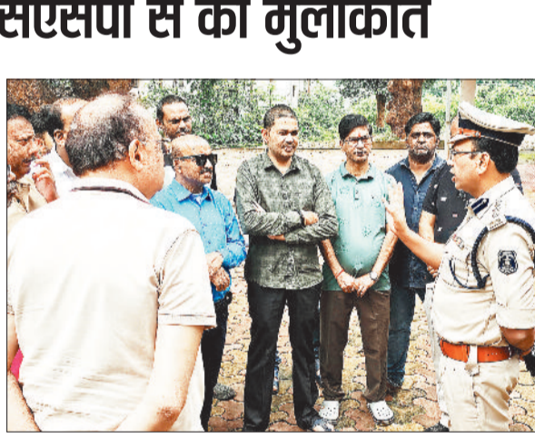
एसएसपी से भेंट करते व्यापारी संघ।