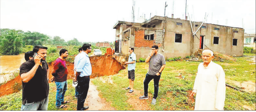
भारी बारिश के बाद सरगांव स्थित वृंदवन कॉलोनी में मिट्टी कटाव होने से क्षतिग्रस्त मकान।

शहर के दूरस्थ एवं सुविधाविहीन इलाके तो लगातार आवासीय कॉलोनियों विकसित हो ही रही हैं भू-माफिया अब आसपास के गांवों में भी धड़ल्ले से प्लॉट काट कर बेच रहे हैं। जरूरतमंद लोग भी भविष्य की चुनौतियों की चिंता किए बिना जहां-तहां प्लॉट खरीदकर बेतरतीब निर्माण कर रहे हैं। कॉलोनियों के लिए शासन ने कड़े नियम बनाए हैं लेकिन दबांगे पर इन नियमों का कोई प्रभाव नहीं पड़ता। मोटी कमाई के लिए दबांगे ऐसे स्थानों की जमीन सस्ते में खरीद रहे हैं जो निचले इलाकों में शुमार हैं तथा पानी निकासी का प्राकृतिक मार्ग है। दबांगे पानी निकासी के मार्गों, पुल-पुलियों को अवरोध कर मिट्टी भर दे रहे हैं तथा प्लॉट काटकर जरूरतमंद लोगों को बेच रहे हैं। लोग भी सड़क, बिजली, पानी एवं जल निकासी की चिंता किए बगैर बेतरतीब ढंग से आवासों का निर्माण कर रहे हैं। ऐसी कॉलोनियों में कुछ घर ऊंचाई पर हैं