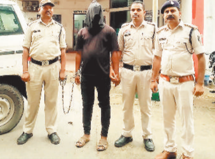
पुलिस गिरफ्त में लूट का आरोपी।

जिले के थाना क्षेत्र कुनकुरी अंतर्गत एक युवती से मोबाइल लूटकर भागने वाले आरोपी को पुलिस ने मात्र तीन दिन में गिरफ्तार कर जेल भेज दिया। आरोपी की पहचान सीसीटीवी फुटेज और मुखबिर की सूचना के आधार पर की गई। पुलिस ने आरोपी को गांव से धरदबोवा।