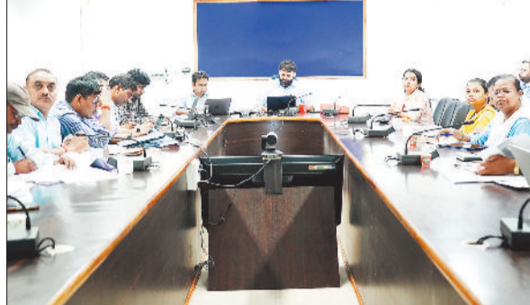
अधिकारियों की बैठक लेते कलेक्टर।

बैठक में कलेक्टर ने विभिन्न ग्रामों में विकास कार्यों को पूरा करने में हो रही देरी पर सजाना लेते हुए ऐसे कार्य जिनमें ठेकेदारों को कार्य स्वीकृति के उपरांत भी कार्य नहीं किया जा रहा है उनपर सख्त कार्रवाई करते हुए उनके स्वीकृति निरस्त कर अन्य ठेकेदार को प्रदान करके कार्य पूर्ण कराने के निर्देश दिए गए। उन्होंने निर्माण कार्यों में गुणवत्ता पर सभी जनपद पंचायतों के सीईओ को विशेष ध्यान देने को कहा। कलेक्टर ने तहसील जशपुर